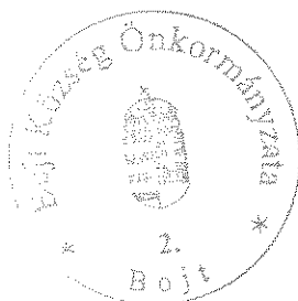
Bereginé Szegedi Hajnalka polgármester