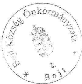
Bereginé Szegedi Hajnalka polgármester