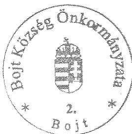
Bereginé Szegedi Hajnalka polgármester