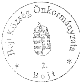
Bereginé Szegedi Hajnalka polgármester