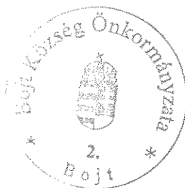
Bereginé Szegedi Hajnalka polgármester