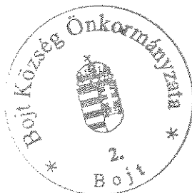
Bereginé Szegedi Hajnalka polgármester