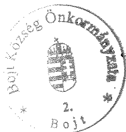
Bereginé Szegedi Hajnalka polgármester